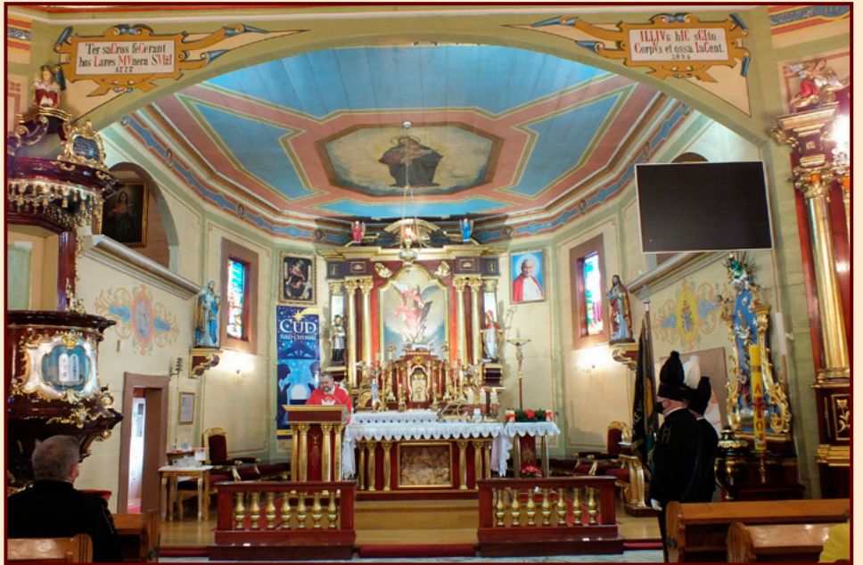
4.12.2020 - BARBÓRKA KOŃCZYCE WIELKIE